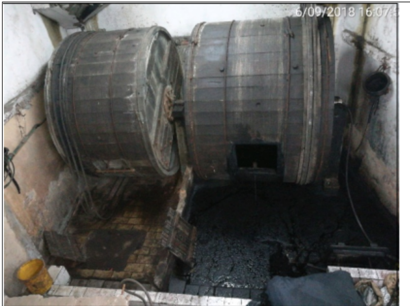
Registro fotográfico anexo a Informe técnico No. 2427 del 2018.

Con ocasión de lo anterior se imponen las siguientes medidas de suspensión de actividades: